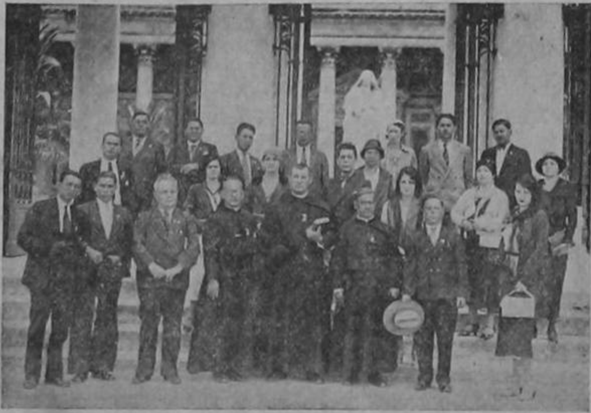
Grupo de los excursionistas actualmente en Italia

Fotografía tomada en Roma en el portal de la Iglesia de San Pablo extramuros por el servicio de crónica fotográfica de la Ilustración Vaticana